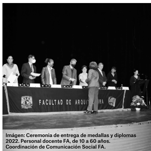
Imagen: Ceremonia de entrega de medallas y diplomas 2022. Personal docente FA, de 10 a 60 años. Coordinación de Comunicación Social FA.

En el Teatro "Estefanía Chávez Barragán" se llevó a cabo el evento para reconocer el trabajo las y los académicos de la FA. Se entregaron preseas al personal cuya trayectoria ha sido desde 10 hasta 60 años.