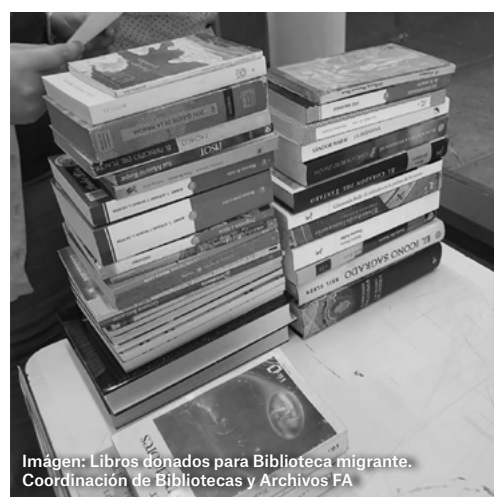
Imagen: Libros donados para Biblioteca migrante. Coordinación de Bibliotecas y Archivos FA.

¡Gracias a todas las personas que participaron!