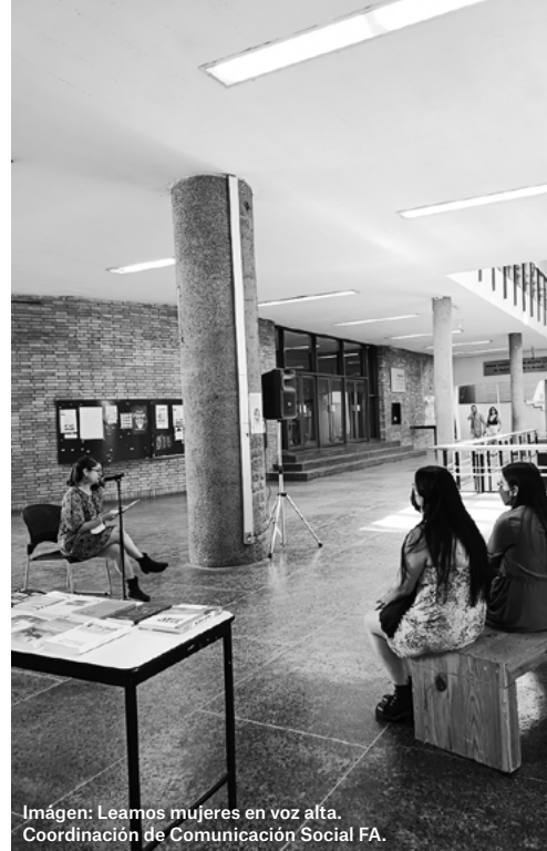
Imagen: Leamos mujeres en voz alta. Coordinación de Comunicación Social FA.