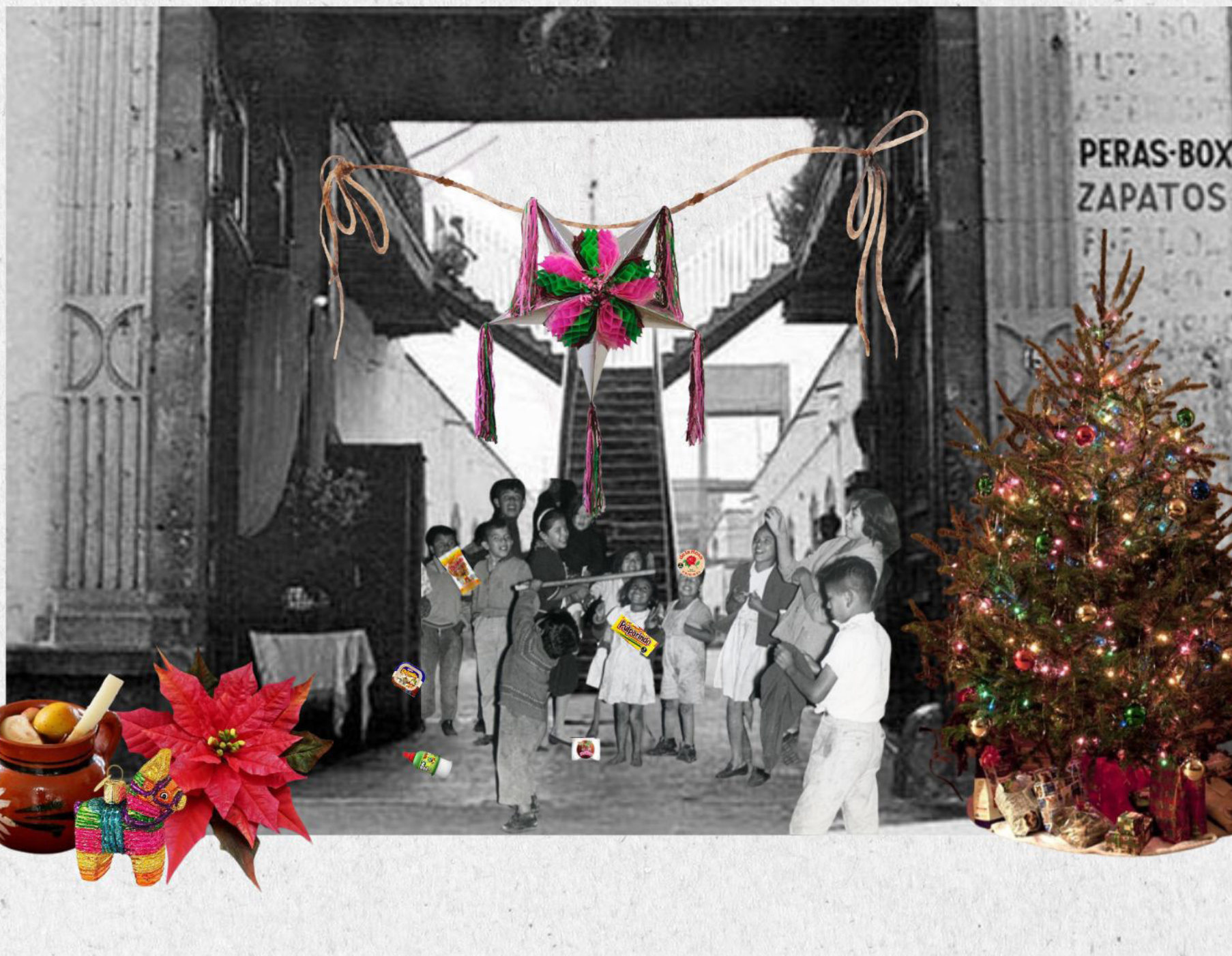
Felices fiestas FA 2023.