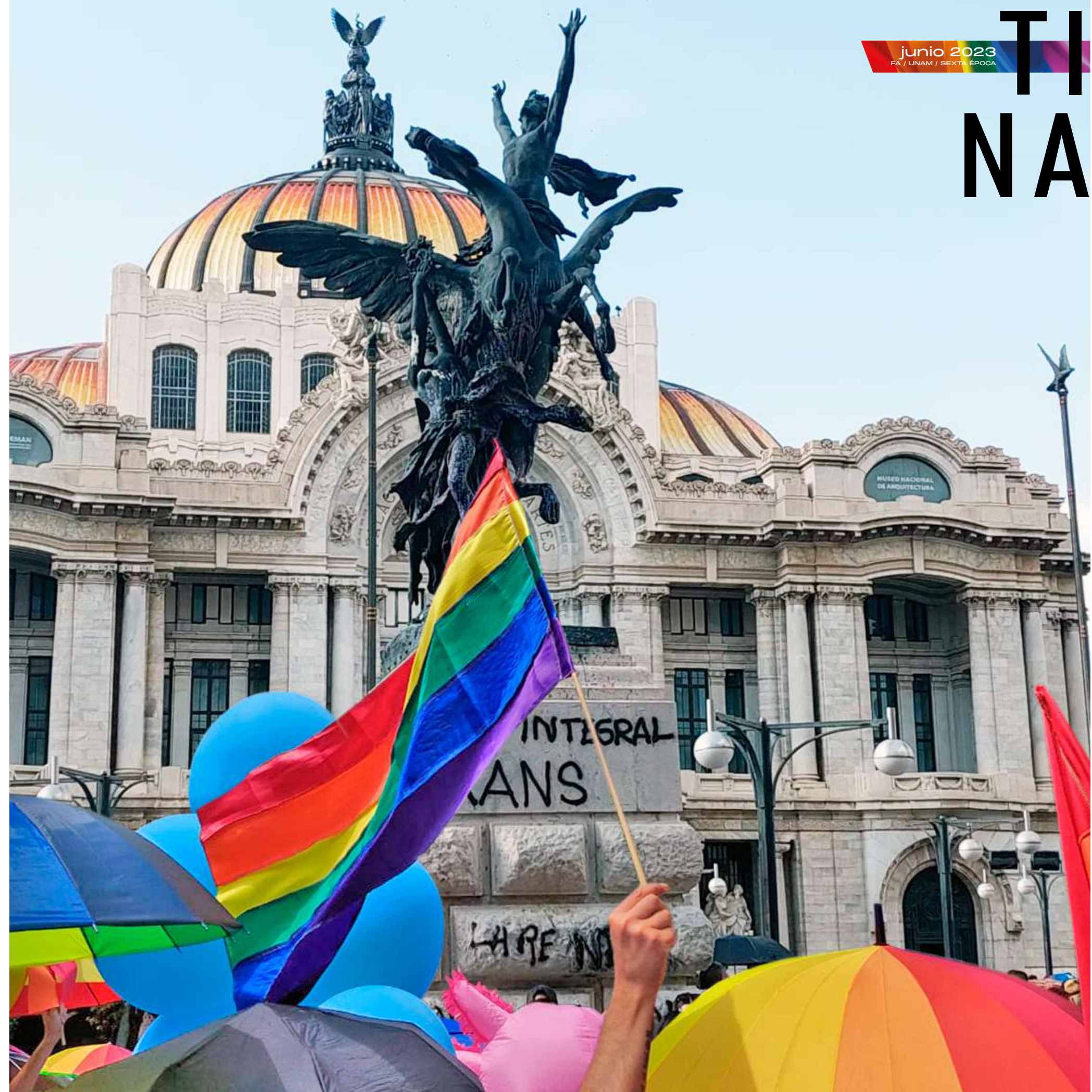
Marcha del Orgullo LGBTQ+ de la Ciudad de México 2023.