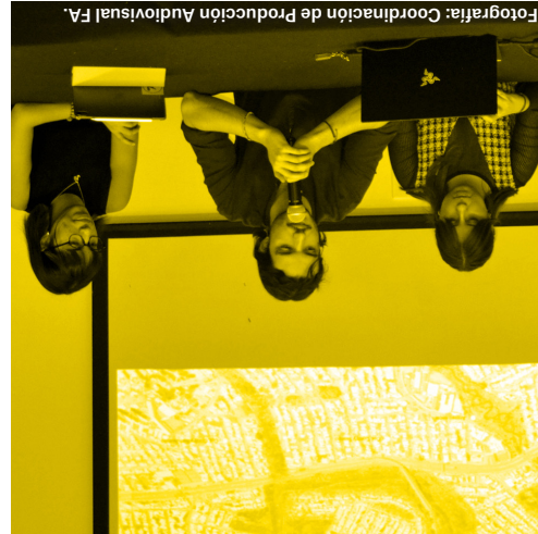
Presentación final del Seminario Especial de Titulación Intersticios: Urbanismos meteorológicos, calor y agua en Monterrey COMUNIDAD / 31.05.23