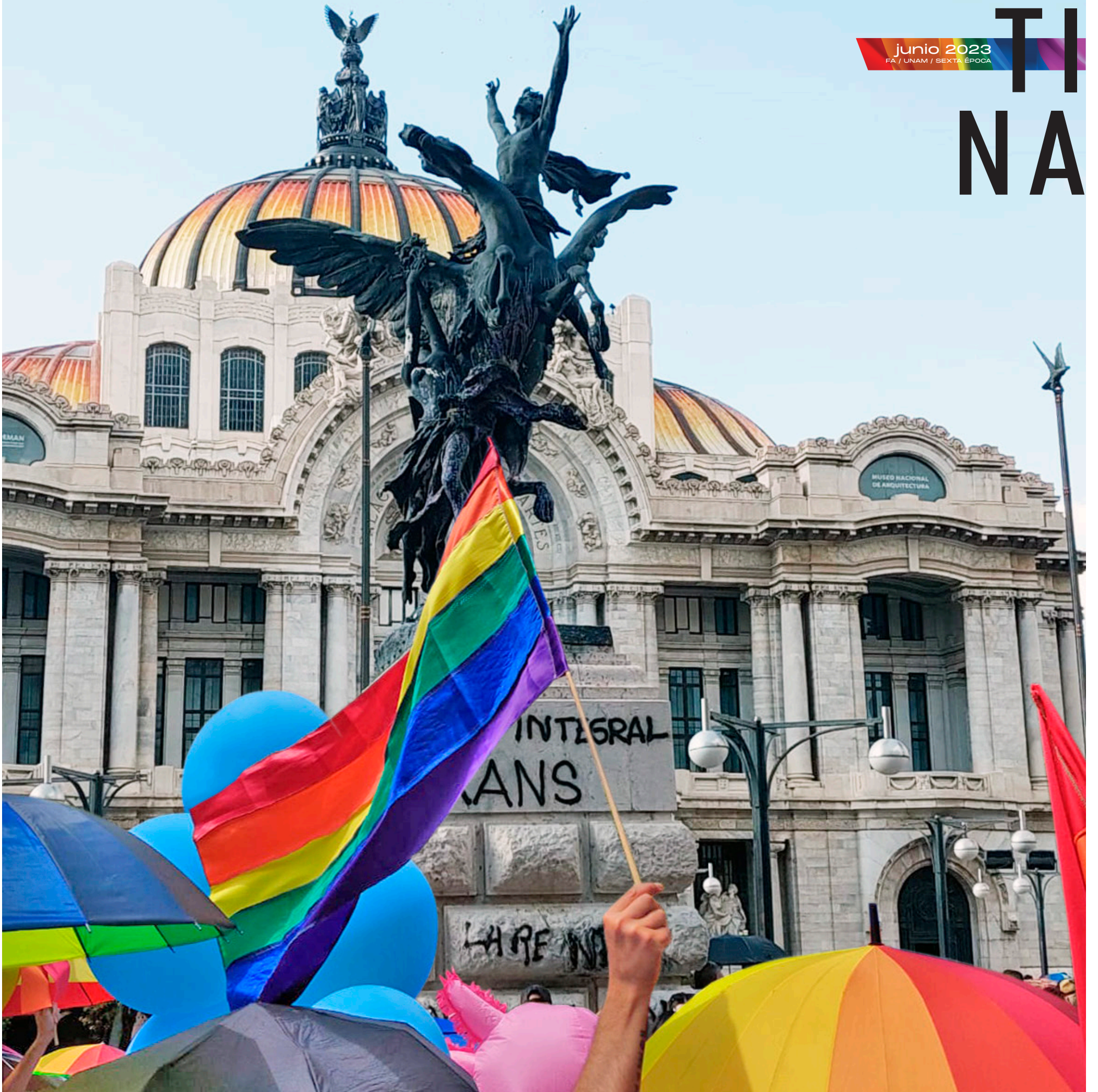
Marcha del Orgullo LGBTQ+ de la Ciudad de México 2023.