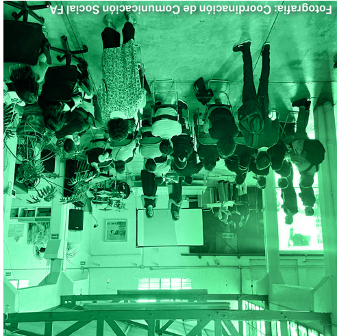
Presentación final del Seminario Especial de Titulación RX: (des) emplazamientos COMUNIDAD / 02.06.23