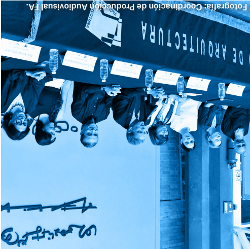
Entrega de los premios Abraham Zabudovsky y Alinka Kuper a las mejores tesis de Licenciatura 2020 y 2021 COMUNIDAD / 09.06.23