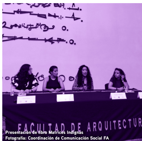
Presentación de libro Matrices Indignas

Durante la primera semana de marzo, en el vestíbulo de la facultad, se llevó a cabo la inauguración del festival, donde participaron 8 stands de diversas editoriales. De igual se presentaron 9 libros dentro de la Biblioteca Lilia Margarita Guzmán y García. Si te perdiste la inauguración, lo puedes ver por Instagram, en la cuenta de lafauam.mx .