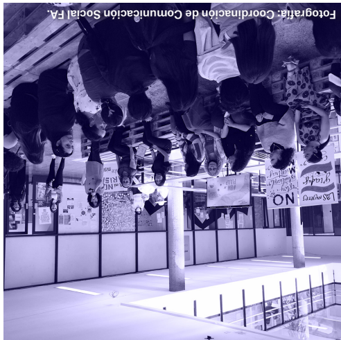
SEMANA DE CONVERSATORIOS: LA CIUDAD DE LAS MUJERES GÉNERO / Del 02.03.23 al 07.03.23 Cuatro ejes temáticos: Mujeres materializando la ciudad / La formación profesional desde la perspectiva de género / Espacio doméstico y espacios de cuidado / Mecanismos de autogestión disponibles en la comunidad.