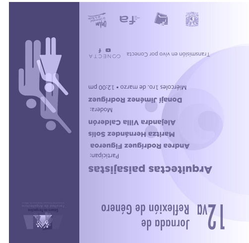
12va Jornada de Reflexión de Género: Arquitectas Paisajistas GÉNERO / 01.03.23