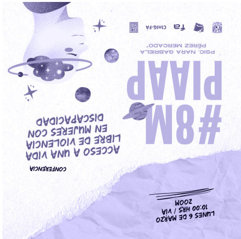
CONFERENCIA: ACCESO A UNA VIDA LIBRE DE VIOLENCIA EN MUJERES CON DISCAPACIDAD GÉNERO / 06.03.23