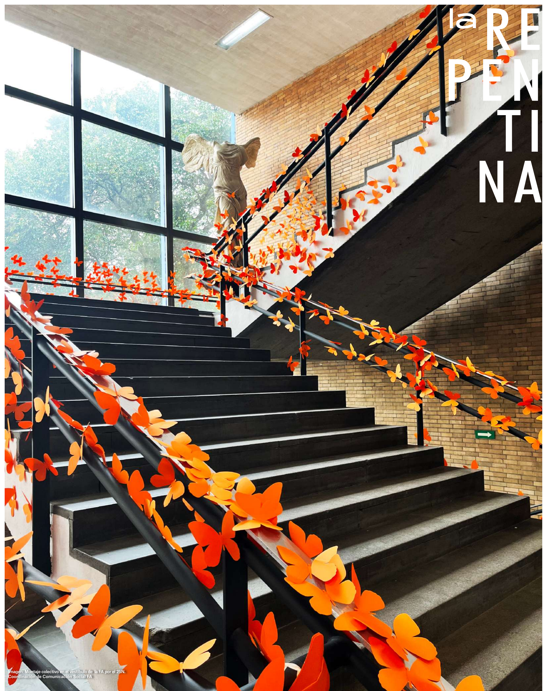
Imagen: Montaje colectivo en el vestíbulo de la FA por el 25N. Coordinación de Comunicación Social FA