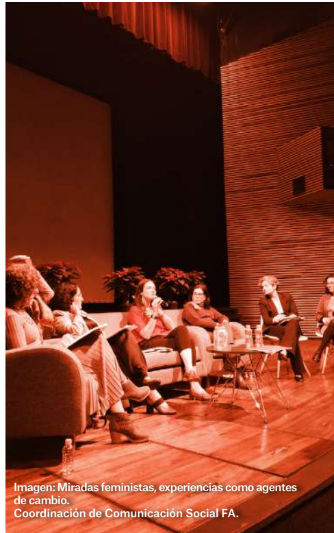
Imagen: Miradas feministas, experiencias como agentes de cambio. Coordinación de Comunicación Social FA.