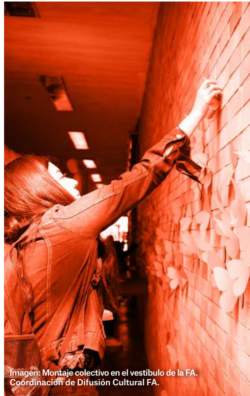
Imagen: Montaje colectivo en el vestíbulo de la FA. Coordinación de Difusión Cultural FA.