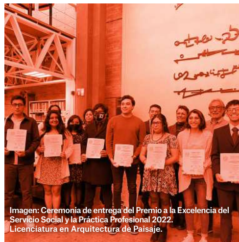
Imagen: Ceremonia de entrega del Premio a la Excelencia del Servicio Social y la Práctica Profesional 2022. Licenciatura en Arquitectura de Paisaje.

Dentro del programa de este evento, fue entregado el Premio a la Excelencia del Servicio Social y la Práctica Profesional 2022, el pasado 23 de noviembre.