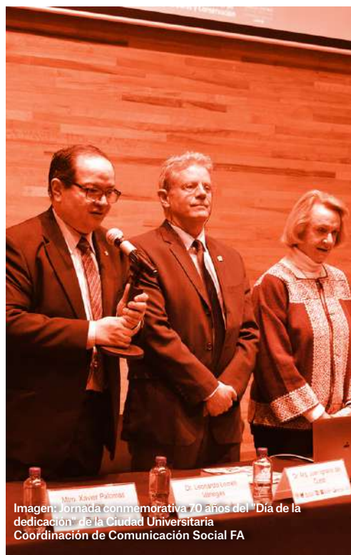
Imagen: Jornada conmemorativa 70 años del "Día de la dedicación" de la Ciudad Universitaria. Coordinación de Comunicación Social FA

Si te la perdiste, la puedes ver por: #ConectaFA , en Youtube y en Facebook