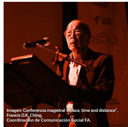
Imagen: Conferencia magistral "Space, time and distance", Francis D.K. Ching.

En el marco de este encuentro, se entregó la Medalla Manuel Tolsá al Dr. Francis D.K. Ching, por su destacada trayectoria y sus aportaciones a la Arquitectura.