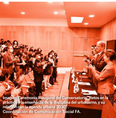
Imagen: Ceremonia Inaugural del Conversatorio "Retos en la práctica y la enseñanza de la disciplina del urbanismo, y su relación con la agenda urbana 2030". Coordinación de Comunicación Social FA.

Si te perdiste la inauguración de este evento, la puedes ver por #ConectaFA , en Youtube y en Facebook