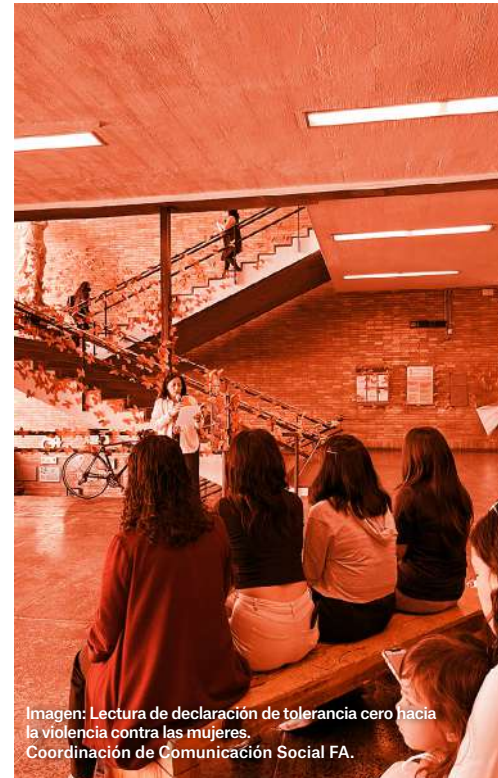
Imagen: Lectura de declaración de tolerancia cero hacia la violencia contra las mujeres.