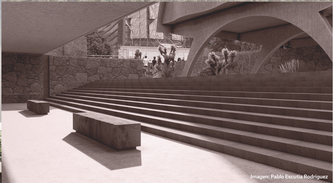
Imagen: Pablo Escutia Rodríguez