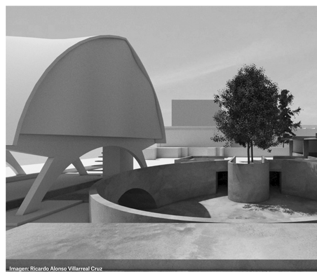
Imagen: Ricardo Alonso Villarreal Cruz