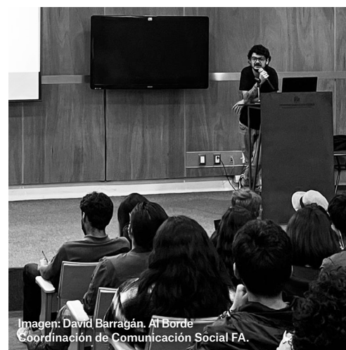
Imagen: David Barragán. Al Borde. Coordinación de Comunicación Social FA.