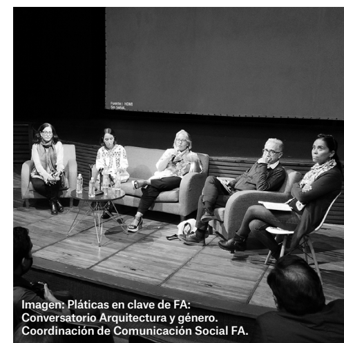
Imagen: Pláticas en clave de FA: Conversatorio Arquitectura y género. Coordinación de Comunicación Social FA.

Si te lo perdiste, la puedes ver por #ConectaFA, en Youtube y en Facebook