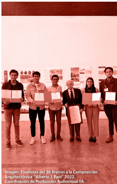
Imagen: Finalistas del 38 Premio a la Composición Arquitectónica "Alberto J. Pani" 2022.

Si te la perdiste, la puedes ver por #ConectaFA, en Youtube y en Facebook