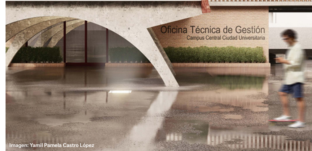
Imagen: Yamil Pamela Castro López