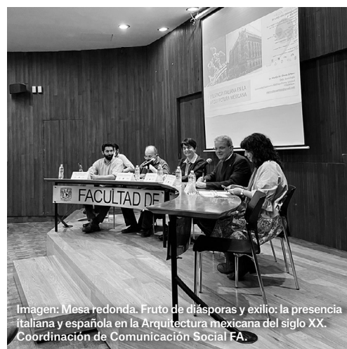
Imagen: Mesa redonda. Fruto de diásporas y exilio: la presencia italiana y española en la Arquitectura mexicana del siglo XX. Coordinación de Comunicación Social FA.