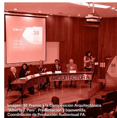
Imagen: 38 Premio a la Composición Arquitectónica "Alberto J. Pani". Presentación y bienvenida.

Si te la perdiste, la puedes ver por #ConectaFA, en Youtube y en Facebook