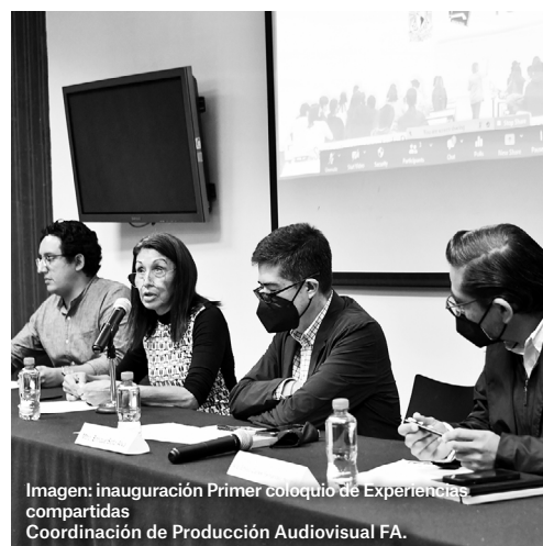
Imagen: inauguración Primer coloquio de Experiencias compartidas. Coordinación de Producción Audiovisual FA.