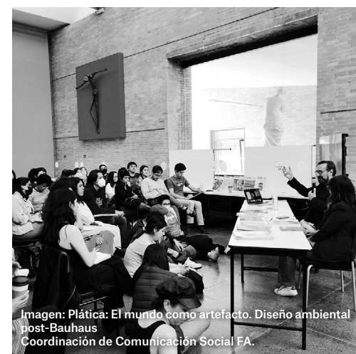
Imagen: Plática: El mundo como artefacto. Diseño ambiental post-Bauhaus. Coordinación de Comunicación Social FA.

Inauguración de la exposición: Trazos en diálogo. 20 años del Archivo de Arquitectos Mexicanos