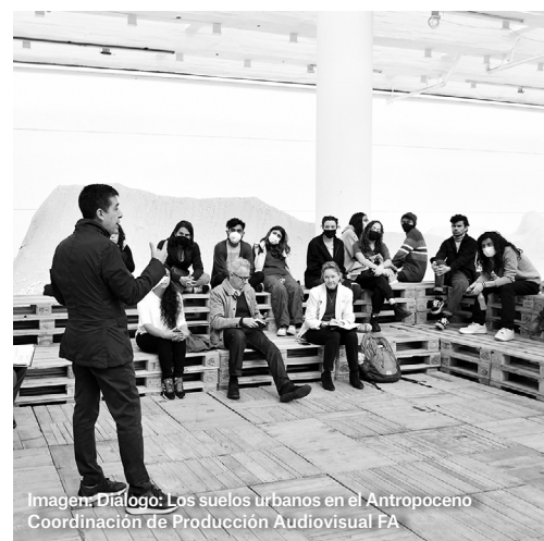
Imagen: Diálogo: Los suelos urbanos en el Antropoceno.