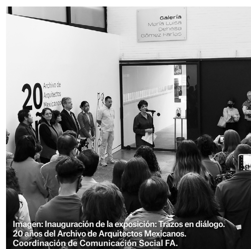
Imagen: Inauguración de la exposición: Trazos en diálogo. 20 años del Archivo de Arquitectos Mexicanos. Coordinación de Comunicación Social FA.