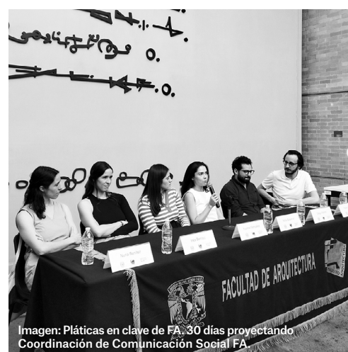
Imagen: Pláticas en clave de FA: 30 días proyectando. Coordinación de Comunicación Social FA.