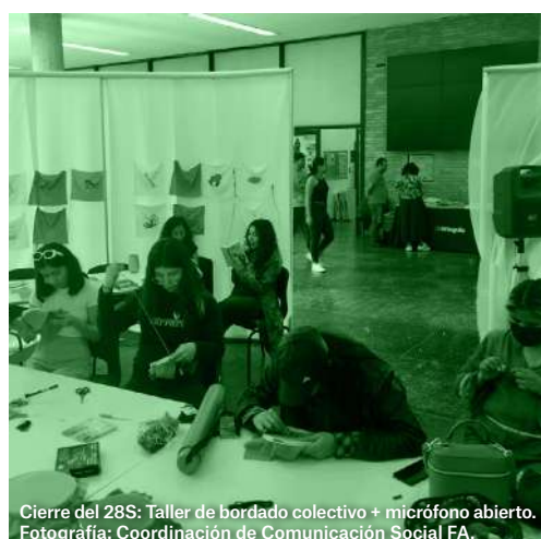
Cierre del 28S: Taller de bordado colectivo + micrófono abierto.