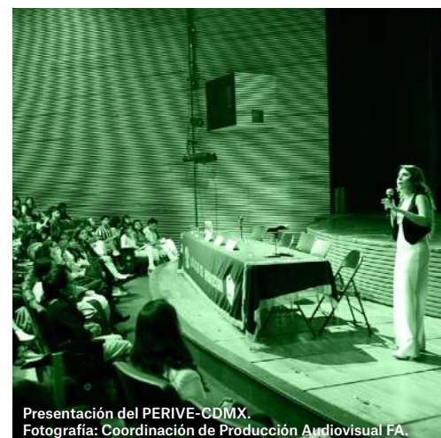
Presentación del PERIVE-CDMX.

Si te la perdiste, la puedes ver por #ConectaFA , en YouTube .