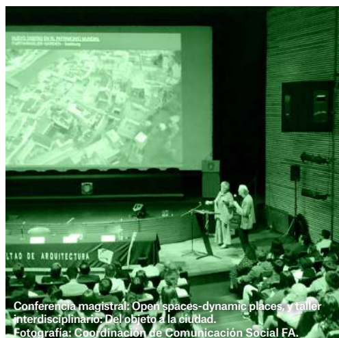
Conferencia magistral: Open spaces-dynamic places y taller interdisciplinario: Del objeto a la ciudad.

Si te perdiste esta conferencia magistral, la puedes ver por #ConectaFA , en YouTube .