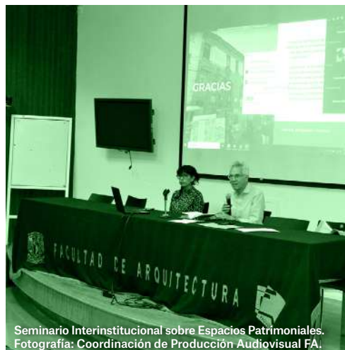
Seminario Interinstitucional sobre Espacios Patrimoniales.

Si te la perdiste, la puedes ver por #ConectaFA , en Facebook y YouTube .