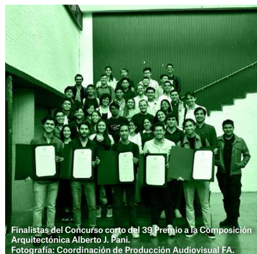
Finalistas del Concurso corto del 39 Premio a la Composición Arquitectónica Alberto J. Pani.

Si te perdiste la ceremonia de cierre de la etapa corta, la puedes ver por #ConectaFA , en Facebook y YouTube .